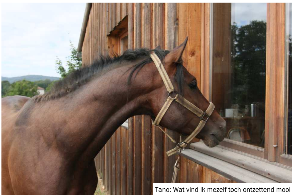
Tano: Wat vind ik mezelf toch ontzettend mooi