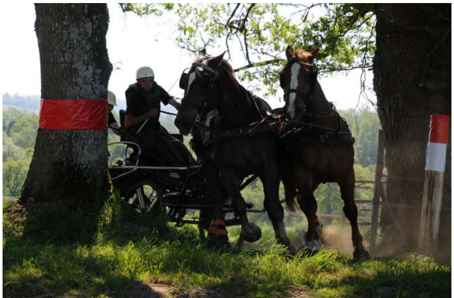
Deze menhindernis zal na aanleg van de TGV niet meer bereikbaar zijn met een aanspanning!