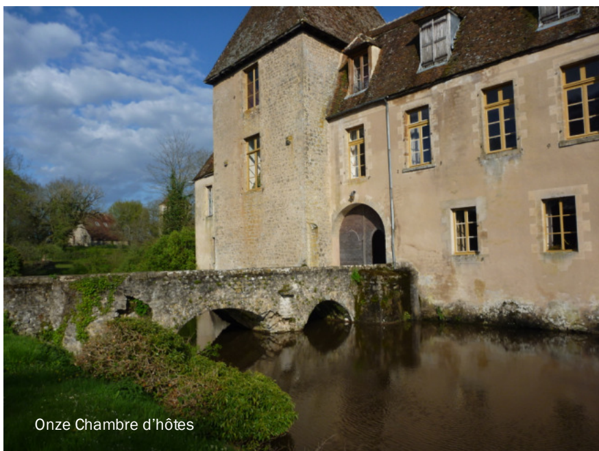
Onze Chambre d'hôtes

Op naar de chambre d'hôtes: kasteel Lantilly bij Corbigny. Tja, dat was me even een contrast: veel gebouwen in staat van instorten, veel rommel, maar een enorme charme. De gracht wordt rechtstreeks door een rivier gevoed. Met de paarden over kleine dijkjes naar hun weide tussen twee riviertjes. Koeien en schapenstallen, een grote duiventoren alles werkelijk schitterend maar als je dichtbij komt eigenlijk gewoonweg een drama voor die eigenaren. Er horen nog steeds enkele honderden hectares bij, maar het rendement is niet genoeg om het onderhoud te betalen.